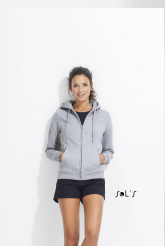
SEVEN WOMEN 47900