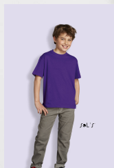
REGENT KIDS 11970